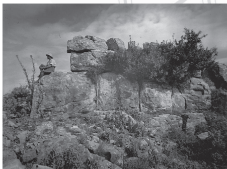
Tavola rotonda su L'intellettuale e il potere: Archeologia nelle zone di guerra

Casa Traversari (Aula Bovini), via San Vitale 30, Ravenna